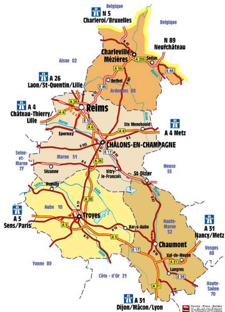
Carte n° 2 : Carte de la région Champagne Ardenne