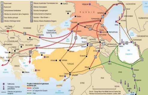
Cartographie: Philippe Rekeacewicz Le Monde diplomatique

Au mois d'avril 1999, était inauguré un nouvel oléoduc reliant Bakou à Novorossiisk (port russe sur la mer Noire) et contournant la Tchétchénie. Ce pipeline a une importance capitale dans la géostratégie de la Russie car il lui permet de garder un contrôle sur le transport pétrolier dans la région.